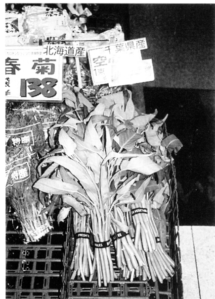
図7. 東京のスーパーマーケットで市販されていたクウシンサイ

シア)：学名のIpomoeaはギリシャ語のips (虫)とhomoisos (似る)の意味で，つる性の茎を虫が地面を這うように見たたものである。またreptansは匍匐する，aquaticaは水生の意味で，英語のconvolvulusは西洋ヒルガオの意味である。これから解るようにヒルガオ科の作物でサツマイモに似るが水生で塊根は作らず，茎は中空である(図5)。そして，I. aquaticaが赤茎赤花，I. reptansが青茎白花である(図6)。(農林水産省熱帯農業研究センター1980，矢野1975)。熱帯アジア，ことに中国原産ともいわれ中国南部を始め，インド，インドネシア，スリランカ，台湾など，東南アジアの華僑地域に多く栽培されている(由比1989)。また東南アジアでは河川や湖沼に群生し雑草化している。世界の栽培面積は不明であるが台湾では1968年に2516ha，23，825tも栽培された(農林水産省熱帯農業研究センター1980)。我が国でも最近，地域特産物として関心が高まっているが沖縄県ではパイナ，ウンツァイと呼ばれ，平成11年度は全県で311tが生産され，内訳は豊見城村では210t，名護市で20t，石垣市で17t，具志川市で10tなどである(ホームページ： http://ogb.go.jp/nousui/uchina-mun )。千葉，神奈川県などの東京近郊では契約栽培あるいは市場出荷され，スーパーマーケットで販売されている(図7)。