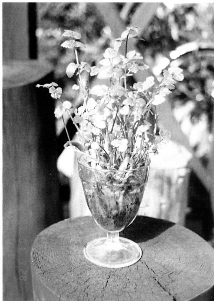
図3. グラスで再生したセリ

汁物や薬味としても適宜利用でき大変重宝である。セリはカロチン、ビタミンC、食物繊維に富み、薬効があることが古くから知られている。煮食すればリュウマチ、神経痛に効果あり、食欲増進、降圧、発汗、解毒作用もあるという。用法としては新鮮なしぼり汁を飲んだり、乾燥したものを煎じて飲む。また風呂に入れてしもやけを治すとも言われる(寺林, 2001)。このようにセリは