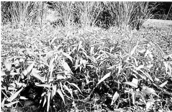
図6. センター内のガラス室で開花したクウシンサイ